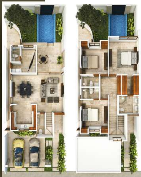
PLANTA MODELOS VENTO

Modelo LEVANTE no cuenta con balcon en recámara principal