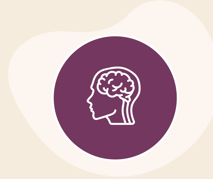
Actividades de estimulación cognitiva