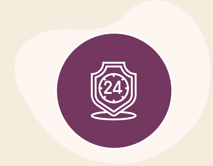
Seguridad, atención y vigilancia 24 Hrs