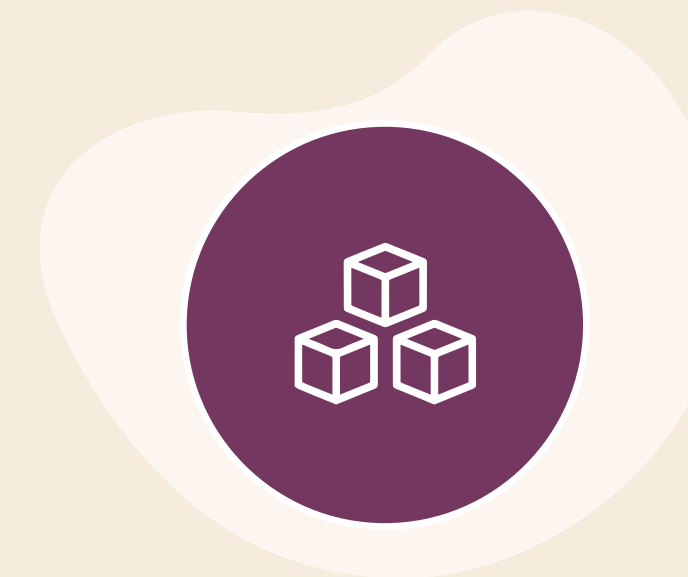
Salas de usos múltiples