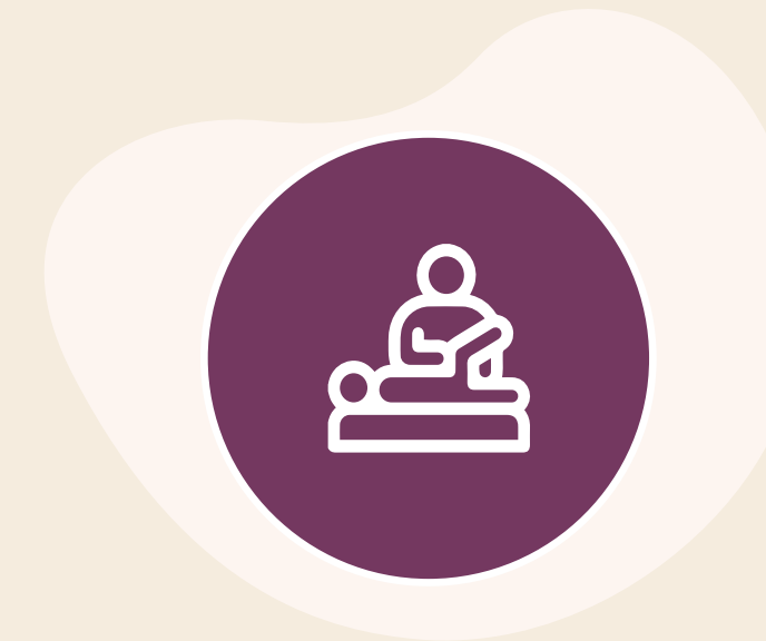
Fisioterapia y rehabilitación