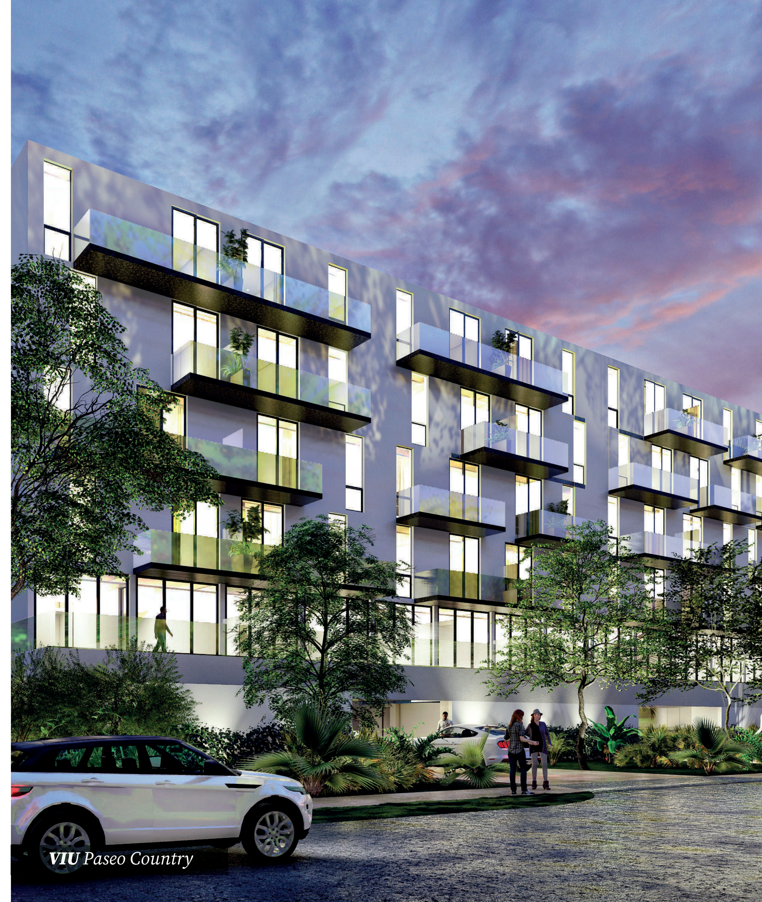
VIU Paseo Country

Somos DIKAP, desarrolladores de proyectos inmobiliarios innovadores diseñados para generar alta plusvalía y ofrecer un estilo de vida único a nuestros residentes.