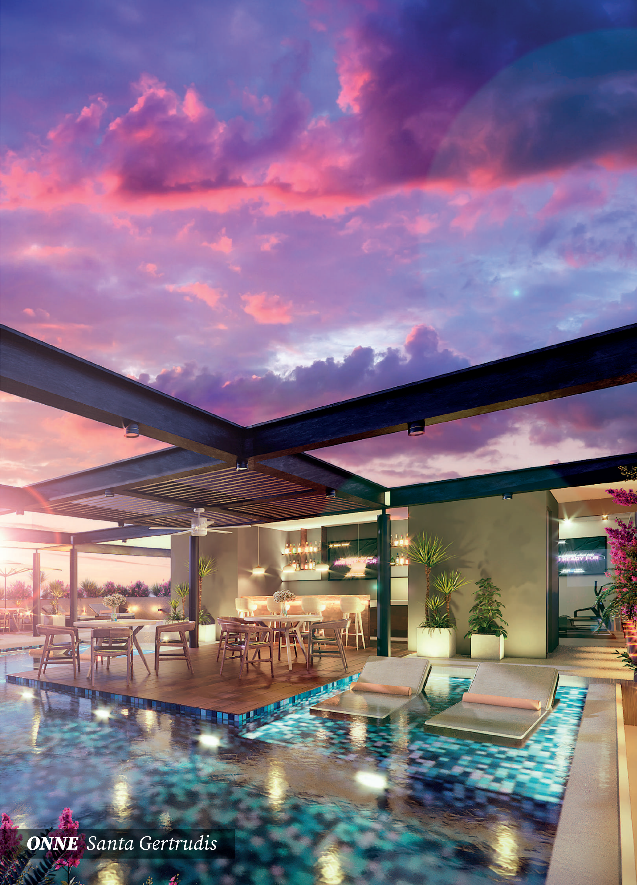
ONNE Santa Gertrudis