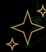
Mirador estelar (espacio para ver estrellas y fogata)