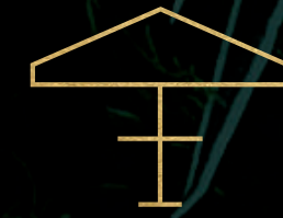
El Deck, El Pórtico y El Patio (Terrazas club)

Vive en un entorno totalmente planeado, donde la vida en comunidad y en familia serán los protagonistas, gracias a las distintas Terrazas club, parques, caminos interconectados con la naturaleza y la seguridad del desarrollo.