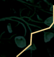
Circuito de jogging