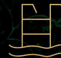
Alberca y canal de nado