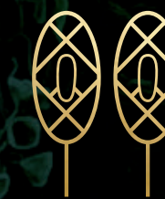
Canchas de Paddle